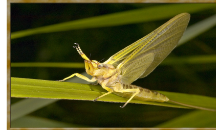
An Chuil Bhealtaine

2. An lá dár gcionn bhí sé fós faoi scamall bróin. Smaoinigh sé ar phlean. “Má shiúlaim níos tapúla, má labhraím níos tapúla, má ithim agus má ólaim níos tapúla, b’fhéidir go n-imeoidh an bhliain níos tapúla,” ar seisean. D’ith sé a bhriceasta an-tapa ar fad. D’ól sé gloine bhainne in aon slog amháin. “Tóg go bog é,” arsa a Mhamáí leis. Amach leis. Shiúil sé an-tapa ar scoil. Bhí sé ann ar fiche tar éis a hocht. Ní raibh aon duine ann. Chiceáil sé carn duilleog. D’fhéach sé suas síos. Ní raibh aon duine ag teacht. Sa deireadh chuala sé carr á pháirceáil i gclós na scoile.